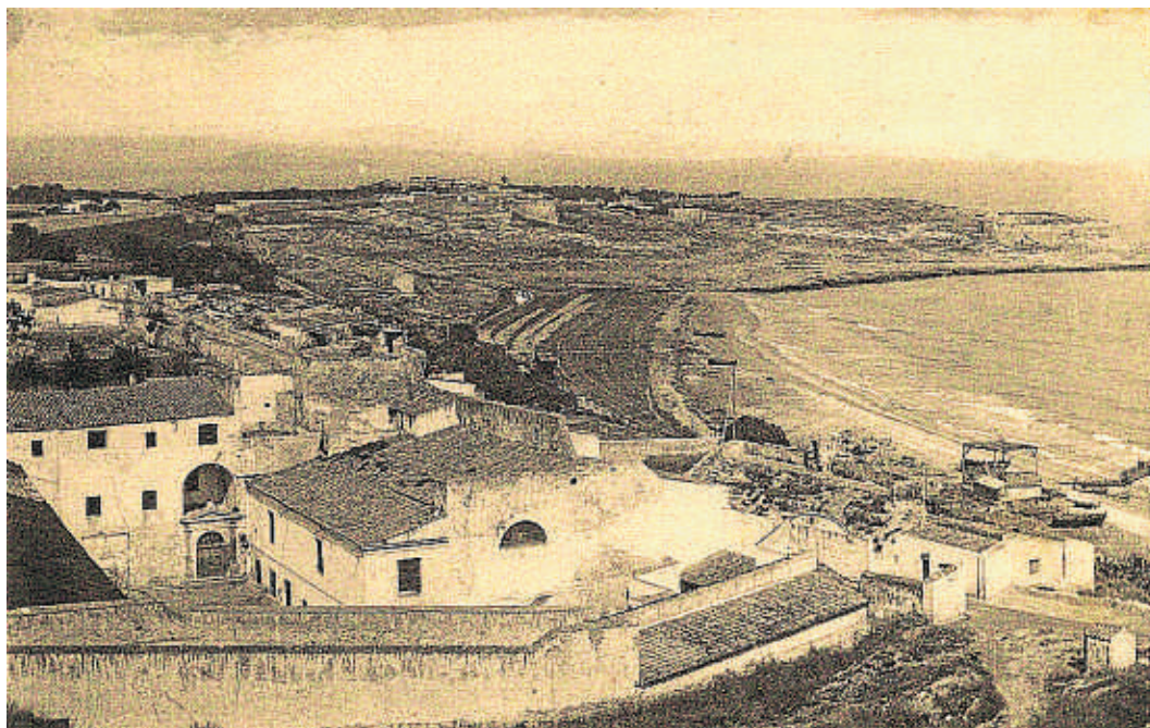
Imatge de l'amfiteatre i església del Miracle quan estaven ocupats pel presidi

Una reial ordre de 18 d'octubre de 1906 decretà la supressió del presidi que hi havia instal·lat en aquell indret i amb aquest pas semblava que es posaria fi a la destrucció d'aquest gran jaciment arqueològic. Però la tortuosa història del monument no va deixar de provocar seriosos enurts als tarrajonins partidaris de conservar-lo. El dia 3 de febrer de 1923 seria una data fatídica per l'església del