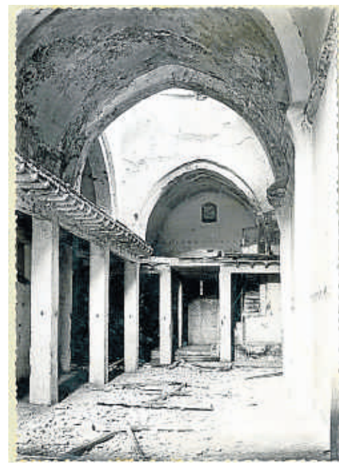
Interior de l'església romànica i gòtica del Miracle abans del seu enderroc