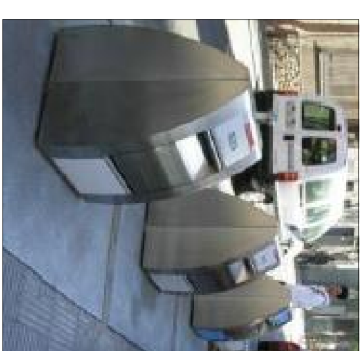
SISTEMA DE RECOLLIDA Easy DE NORD ENGINEERING

CONTENEDORS ENTERRATS DE 5, 4, 3 MC, COL·LOCATS EN BATERIA, ENQUEBELLIS DE 5 MC