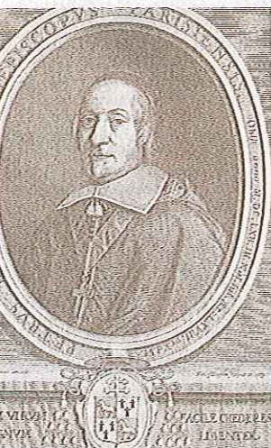
Pèire de Marca

En Pèire de Marca era natural de Gan (Bearn), on hi va néixer el 24 de gener de 1594. Va formar-se al Col·legi dels Jesuïtes d'Auch i estudià dret a Toulouse per acabar ordenant-se sacerdot després d'enviudar l'any 1642. Exercí com advocat. L'any 1622 fou escollit president del parlament de Pau. L'any 1641 fou nomenat bisbe de Couserans, el 1652 arquebisbe de Tolosa de Llenguadoc, i el 1662 arquebisbe de París, encara que no arribà a prendre possessió. Prengué part