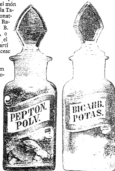
Pots com aquests es trobaven a la farmàcia

Una vitrina exhibia dos esquelets, un d'home i un altre de dona, la qual cosa per una farmàcia semblava no convidar gaire a fer ús dels seus preparats. Eren però esquelets de consulta, ja que en una època en la qual no hi havia ni radiografies, tacs, ni ecografies, els metges necessitaven dis-