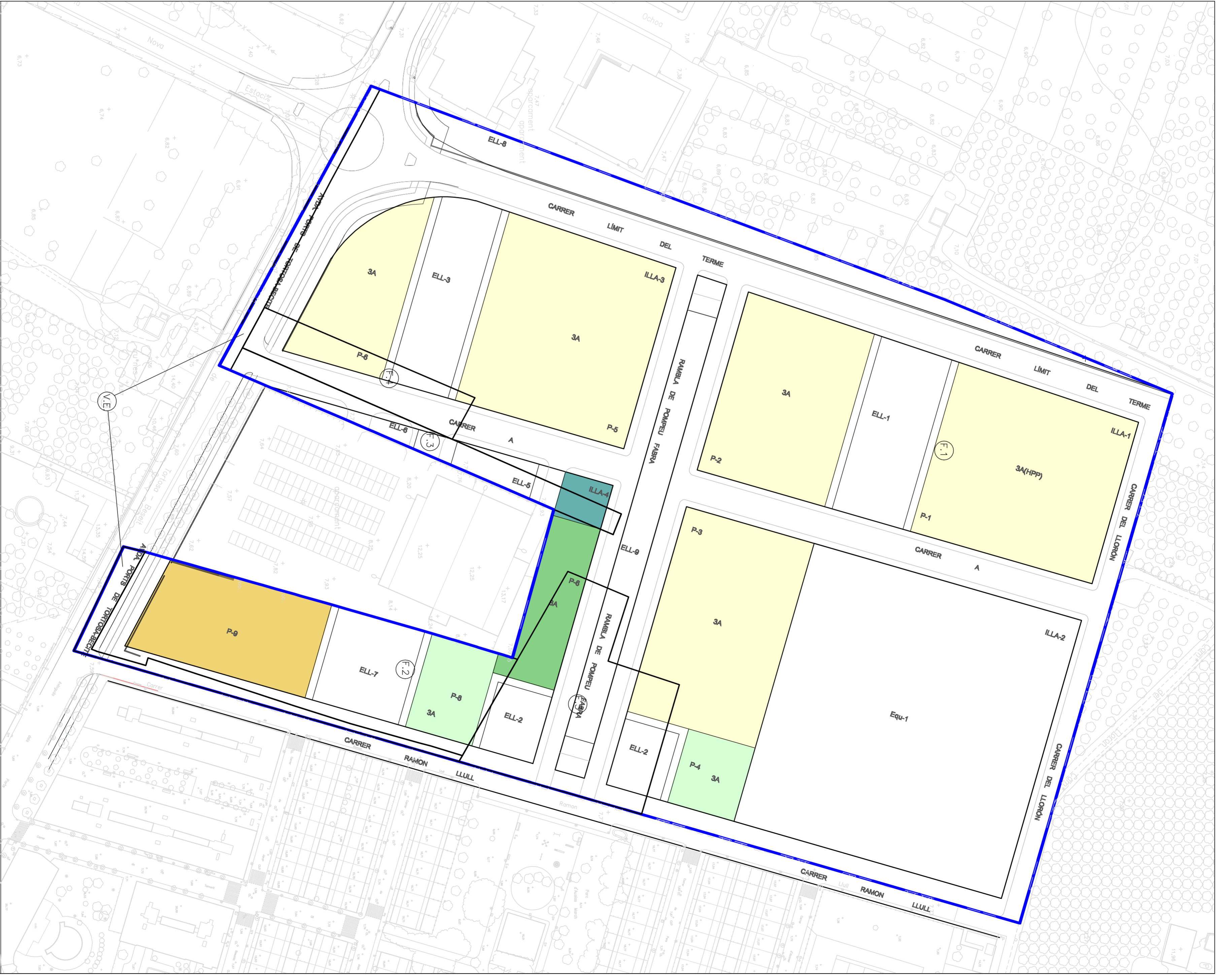
SUPERPOSICIÓ FINQUES RESULTANTS I FINQUES APORTADES