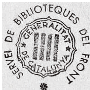
Segell del servei de biblioteques

Editors, escriptors i ciutadans feien donatius a la noble causa d'una nova biblioteca atenent consignes com "Un llibre per a cada infant refugiat. Cada ciutadà un llibre per al front" que la premsa publicava. A Tarragona