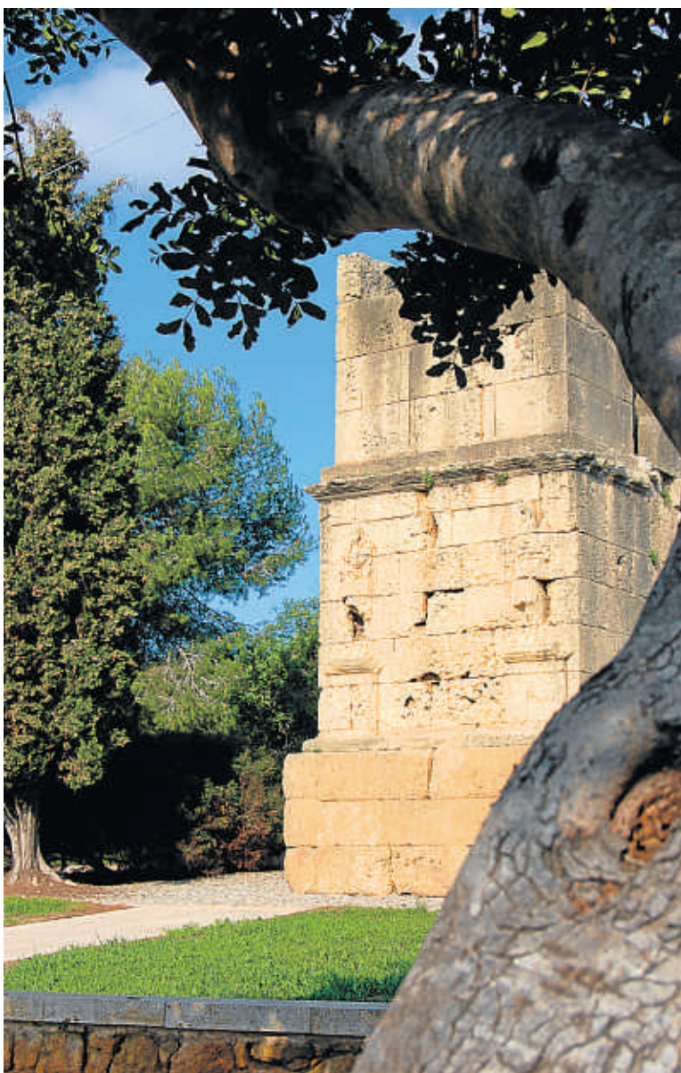
El cor del general Salme va ser dipositat a la torre dels Escipions

talla, entre els quals es comptava el de Salme, que sembla que encapçalava les fileres desafiant les tropes espanyoles i, segons fonts franceses, hauria caigut del cavall d'un tret al cap quan pronunciava el crit de guerra: Brave septième, en avant! ”