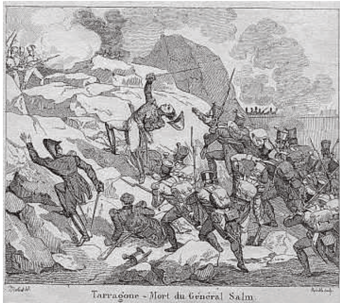
Gravat francès que representa la mort de Salme l'any 1811

La nit del dia 27 al 28 de maig els francesos havien ultimada la construcció d'una bateria d'artilleria relativament a prop del fort tarragoní. Les operacions dels invasors eren difícils ja que treballaven en un terreny del tot hostil. Les bateries s'anaven construint