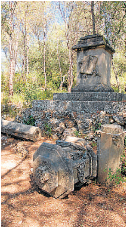
Un monument en ruïnes fet pels germans Puig i Valls recorda les víctimes de la guerra a prop del pont del Diable

peces de calibre 24 a les noves posicions. En una temerària maniobra de sacrifici les tropes franceses van decidir sortir dels seus parapets a l'avançada en direcció al fort, tot i ser conscients que quedarien sense protecció, fent bo el propòsit d'encobrir els moviments de reubicació de la seva pròpia artilleria. Els fets van tenir lloc de nit, des de les vuit i fins les onze. El foc dels defensors tarragonins va acarnissar-se amb els agosarats francesos deixant una estesa de cadàvers al camp de ba-