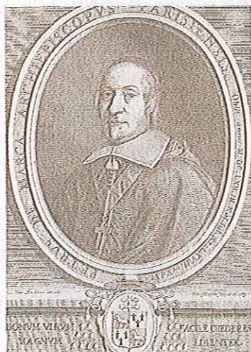
Pèire de Marca

L'elogi que dedicà a Tarragona el bisbe francès no ha passat desapercebut als estudiosos antics i moderns, però potser mereixeria quelcom més. Trobem a faltar aquell text imponent gravat en pedra en algun punt del paisatge urbà, perquè pugui ser llegit no només pels lletraferits sinó també per vianants i turistes.