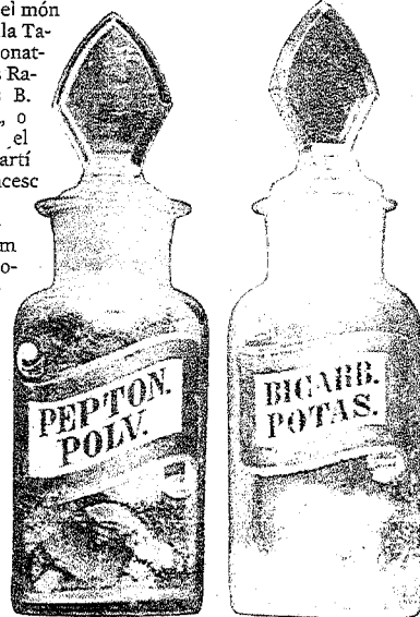
Pots com aquests es trobaven a la farmàcia

Una vitrina exhibia dos esquelets, un d'home i un altre de dona, la qual cosa per una farmàcia semblava no convidar gaire a fer ús dels seus preparats. Eren però esquelets de consulta, ja que en una època en la qual no hi havia ni radiografies, tacs, ni ecografies, els metges necessitaven dis-